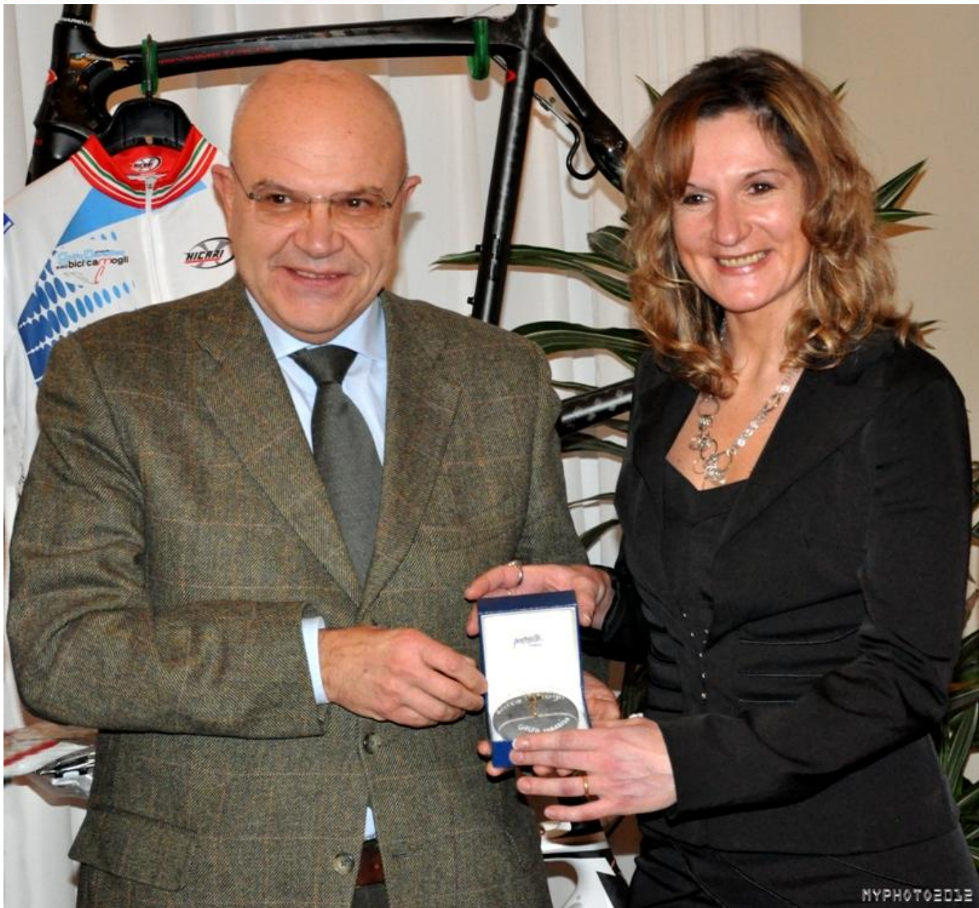
Premio ciottolino Bici Camogli a EDITA PUCINSKAITE