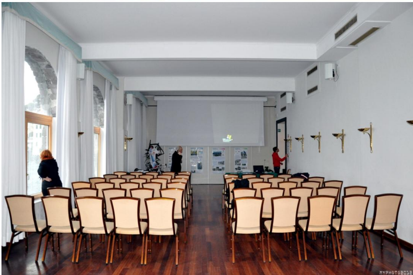
La sala vuota prima della presentazione, fervono i preparativi e qualcuno osserva il panorama...